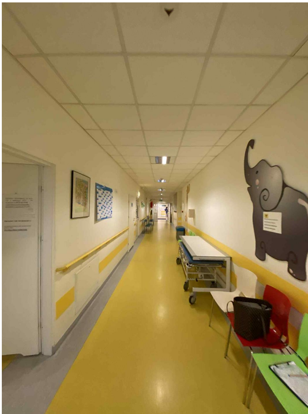
Zdj. 5. Wnętrze budynku Szpitala Dziecięcego.