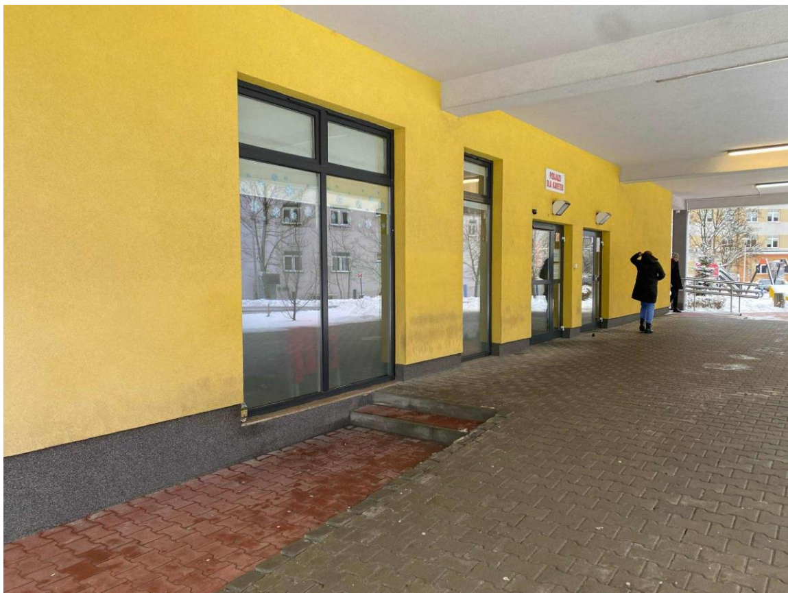
Zdj. 4. Budynek Szpitala Dziecięcego.