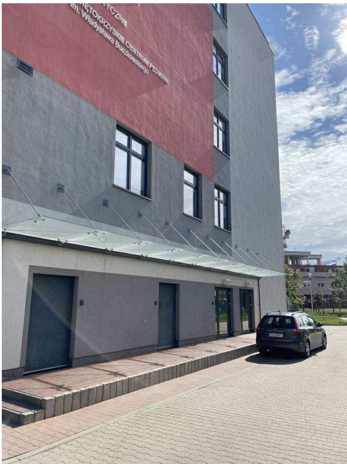
Zdj. 2. Budynek Szpitala Dziecięcego- zdjęcie autorskie.