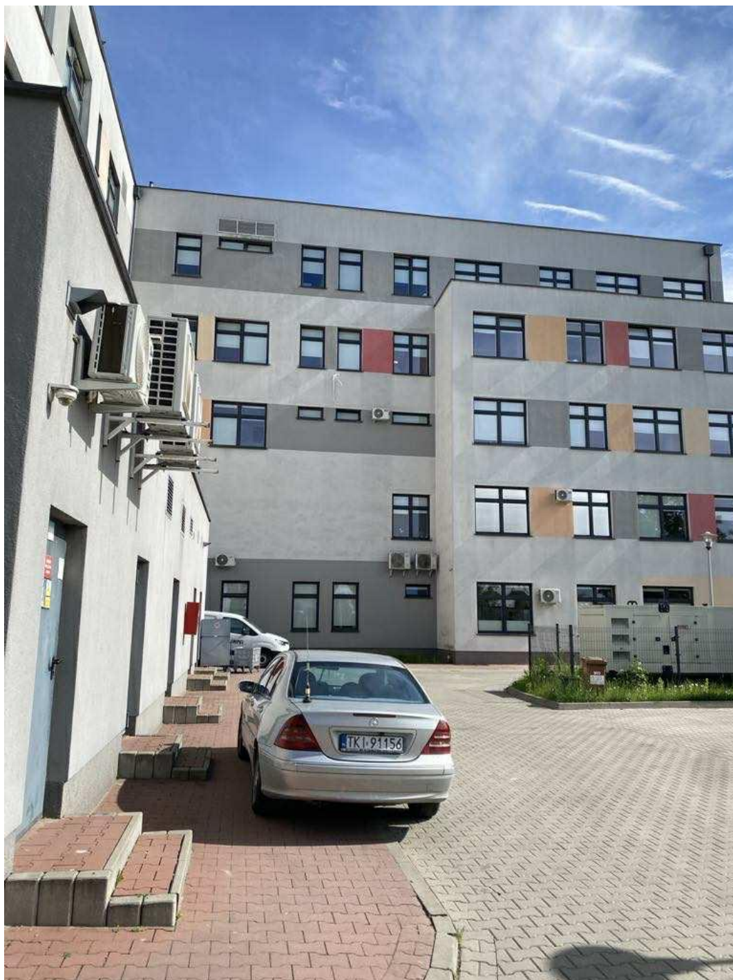
Zdj. 1. Budynek Szpitala Dziecięcego- zdjęcie autorskie.