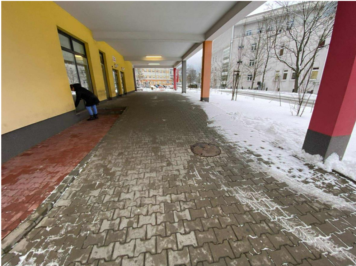
Zdj. 3. Budynek Szpitala Dziecięcego- zdjęcie autorskie.