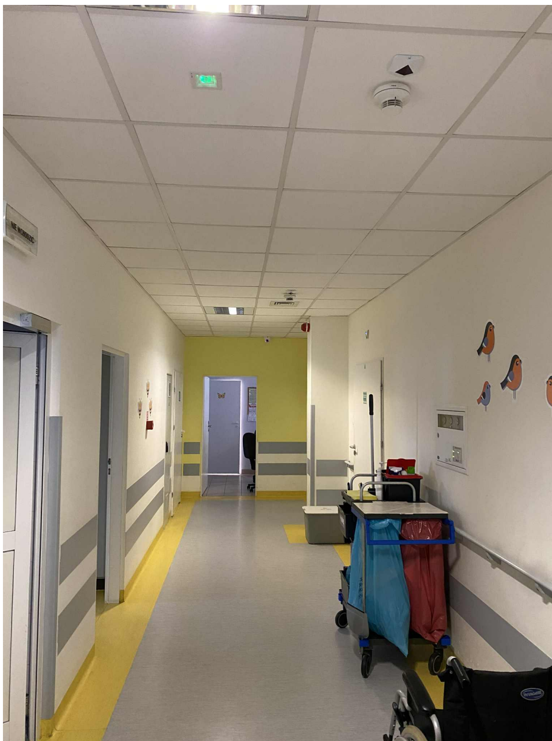
Zdj. 6. Wnętrze budynku Szpitala Dziecięcego- zdjęcie autorskie.